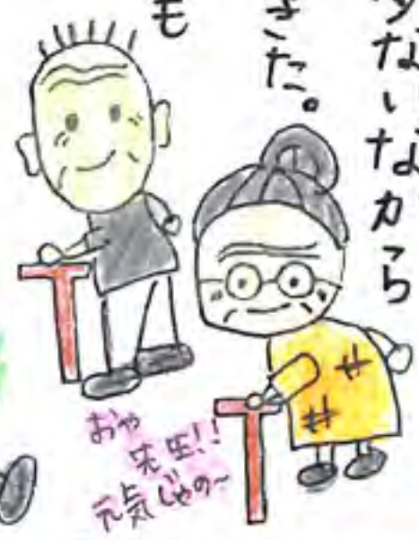
おや、先生！ 元気なのー